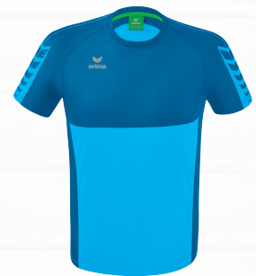
T-SHIRT Gr. 116-164 | Gr. S-3XL Art. Nr. 1082211