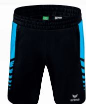
WORKER SHORTS Gr. 116-164 | Gr. S-3XL Art. Nr. 1152216