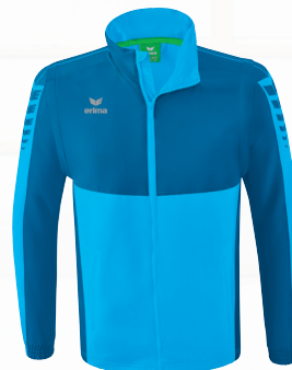
JACKE MIT ABNEHMBAREN ÄRMELN Gr. S-4XL Art. Nr. 1062205