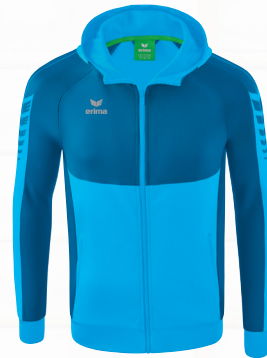
TRAININGSJACKE MIT KAPUZE Gr. 116-164 | Gr. S-3XL Art. Nr. 1032211