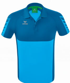
POLOSHIRT Gr. S-3XL Art. Nr. 1112207