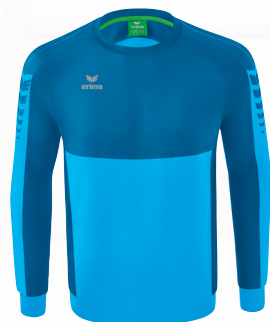
SWEATSHIRT Gr. 116-164 | Gr. S-3XL Art. Nr. 1072207