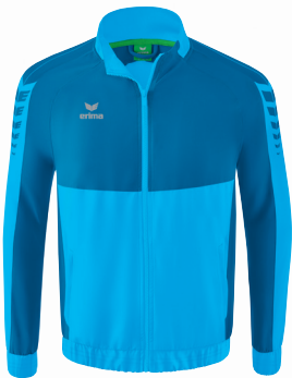
PRÄSENTATIONSJACKE Gr. 128-164 | Gr. S-3XL Art. Nr. 1012207