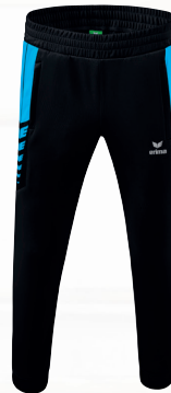
WORKER HOSE Gr. 116-164 | Gr. S-3XL Art. Nr. 1102207