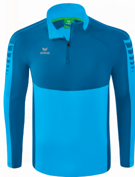
TRAININGSTOP Gr. 128-164 | Gr. S-3XL Art. Nr. 1262207